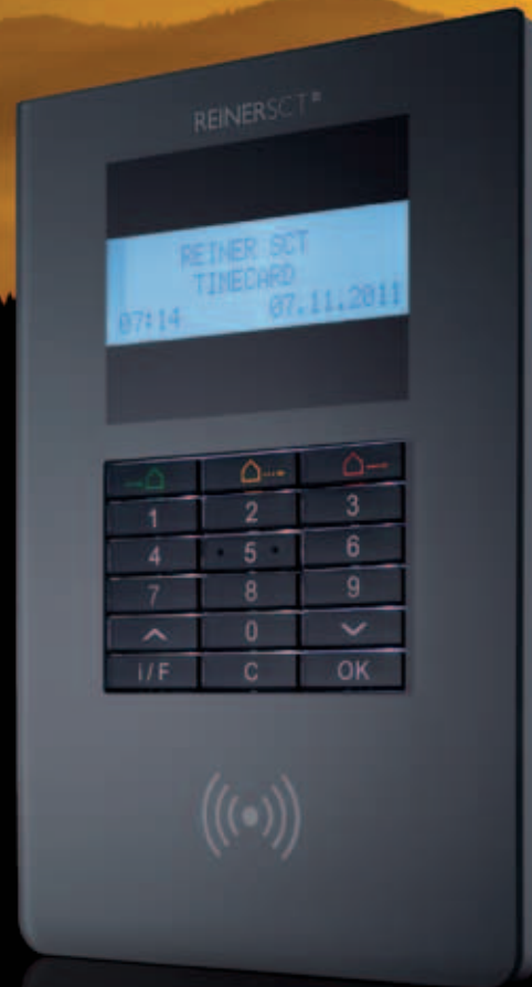
Zeiterfassung und Zutrittskontrolle